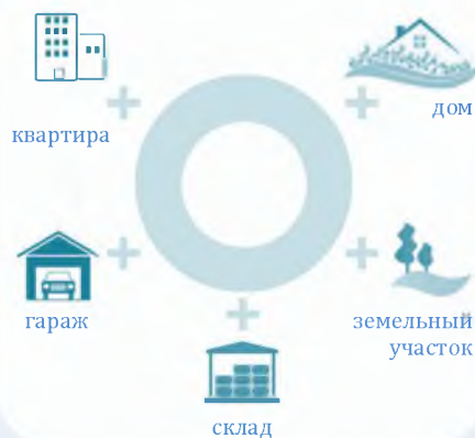
Схема 2. Недвижимое имущество

в) дачный земельный участок - земельный участок, предоставленный гражданину или приобретенный им в целях отдыха (с правом возведения жилого строения без права регистрации проживания в нем или жилого дома с правом регистрации проживания в нем и хозяйственных строений и сооружений, а также с правом выращивания плодовых, ягодных, овощных, бахчевых или иных сельскохозяйственных культур и картофеля).